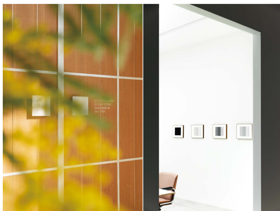
EUGENE STUDIO Studio/Atelier iii

現在は東京近郊にて、作家本人とスタジオスタッフの設計とDIYによる、緑豊かな「Atelier iii」にて、様々な分野のスタッフによって制作が行われています。