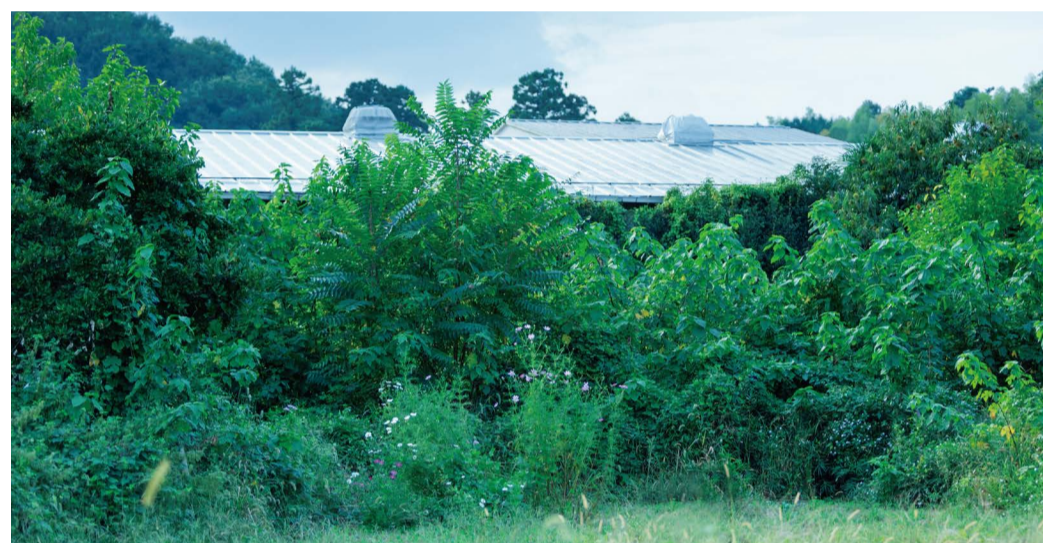
EUGENE STUDIO Studio/Atelier iii